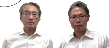
(酒井調査官・戸田調査官)