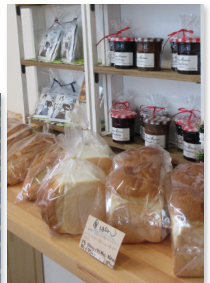
お店情報 営業時間/8:00~17:30 定休日/日・月曜日 住所/東根市一本木3-1-33 TEL.FAX/0237-48-9835