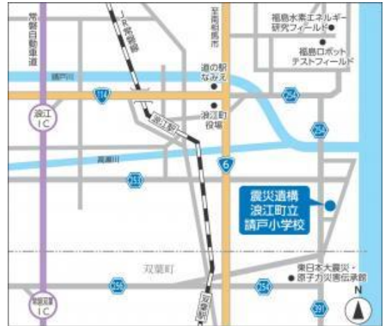
所在地：浪江町ホームページより

「請戸小学校物語」を視察ルートに沿って展示している。2階では、請戸地区の方々の震災当日の動きや、今までの取り組みを映像で紹介している。現在も小学校周辺では、鎮魂の場「先人の丘」や復興記念公園の整備が進んでいる。