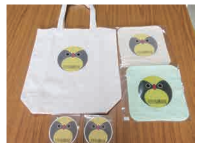
きびたき長井甦るの会グッズ