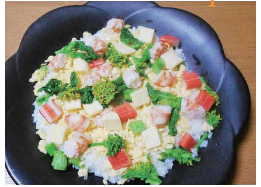
☆ブログ「鈴木淳子の楽しむ食育」もご覧ください♪ http://ameblo.jp/hanamizuki-junko/ レシピ提供：在来作物案内人 鈴木淳子さん