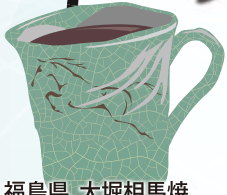
福島県 大堀相馬焼