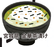
宮城県 金華茶漬け