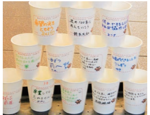
鶴岡市会場 ・ 酒田市会場

鶴岡市・酒田市では鎮魂と復興を願うキャンドルナイト・キャンドル作りワークショップが行われました。