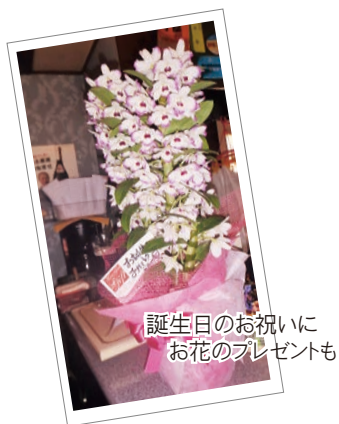
誕生日のお祝いにお花のプレゼントも

誰でも一人では何もできないし、一人でいては、良い考えは浮かばない。毎日悲しいことを考えていては苦しくなる。でも、人と会って話をしていく中で解決したり、違うものの方を知ったり、前進することはたくさんある。過去を振り返つても戻らないし、苦しいのは自分だけじゃない。自分が暗い顔をしていると、なかなか人が寄つてこないけど、少しでも明るく前向きになり、一生懸命やつていけば、必ず誰かが手を差し伸べてくれると思う。私も新しい友だちを作つて、人と話して、たくさん力をもらつてきました。前に進んでいきましょう。