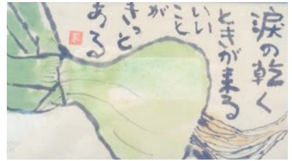
★絵葉書は富岡町の方の作品です。

夫も亡くなっているし、息子も一緒に住んでいないので、自分一人で暮らしていくのにできたら早く、落ち着ける家に住みたいと思っています。