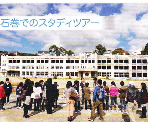
石巻でのスタディツアー

「復興支援に加わりたいけど、大学生が出来る、大学生だから出来る復興支援は何だろう」 こんな思いや考えをお持ちの皆さん、私たちと一緒に活動しませんか？ あなたの思いをカタチに、新しい東北をスタートさせましょう。