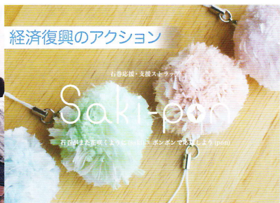
経済復興のアクション