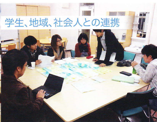
学生、地域、社会人との連携